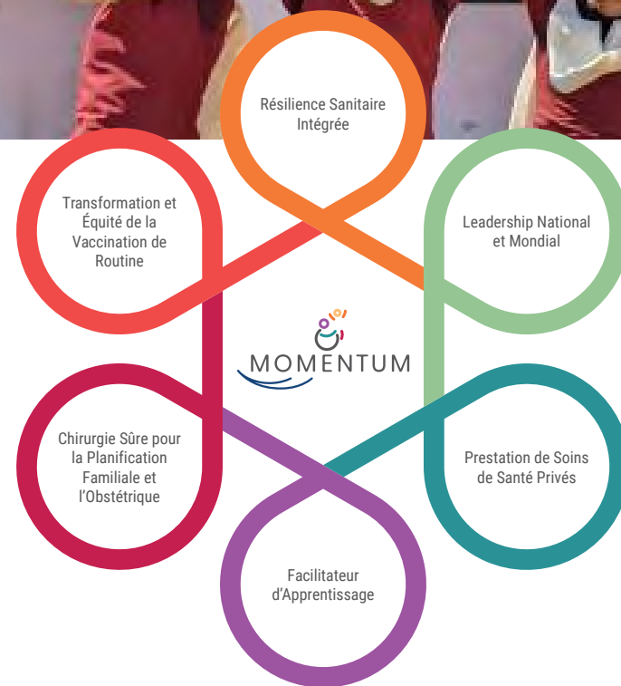
FIGURE 1. ENSEMBLE DE PROJETS MOMENTUM

visant à améliorer la réactivité des systèmes de santé. Il organise en Inde une campagne de création d'espaces sûrs où les jeunes peuvent discuter de santé sexuelle et reproductive.